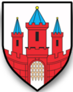
Herb Miasta Malborka